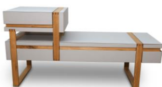
Zweietagiges Sideboard in Eiche und Linoleum [IMG_0013_Warkus_Elias_Platz_3_PM.jpg]

Ausbildungsbetrieb: HVP Plus GmbH, Wilsdruff