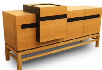
Phonomöbel in Eiche [IMG_0365_Woltmann_Clemens_Platz_1_PM.jpg]

Ausbildungsbetrieb: Tischlerei Brendel, Meißen