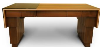
Höhenverstellbarer Schreibtisch in Nussbaum und Ahorn [IMG_0275_Wielsch_Justine_Besucher_Platz_1_PM.jpg]

Besucherumfrage Platz 1: Justine Wielsch (Brandis)